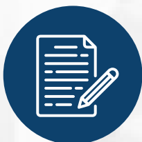
Talleres de redacción